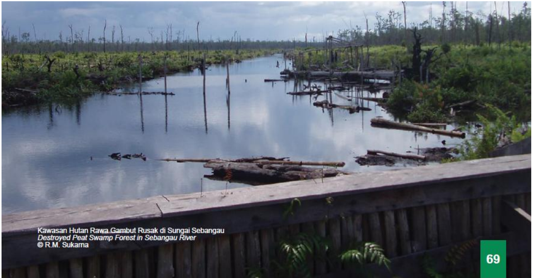
Kawasan Hutan Rawa Gambut Rusak di Sungai Sebangau Destroyed Peat Swamp Forest in Sebangau River