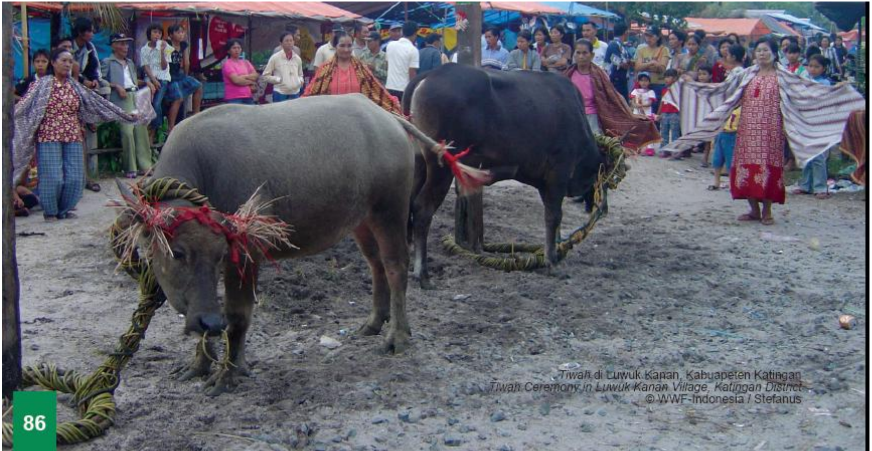
Tiwah di Luwuk Kanan, Kabupatèn Katingan Tiwah Ceremony in Luwuk Kanan Village, Katingan District