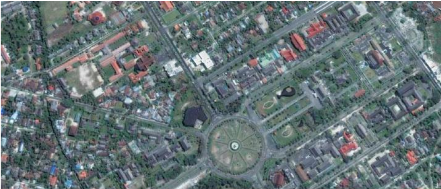
Pusat Kota Palangka Raya/ Palangka Raya Municipality